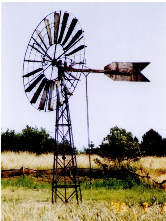
Møllen i 1989.

Den nu noget medtagne arkimedessnegl, der var ved møllens oprindelige placering, er nu gravet op og i samlingen i Roerslev.