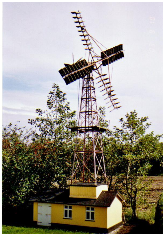
Model af klapsejler.

Klapsejleren, der er 8,2 meter høj og 1,75 m lange vinger er bygget på basis af opmåling af klapsejleren på Møllerup Mølle på Mors - men vingetallet er reduceret fra 5 til 4.