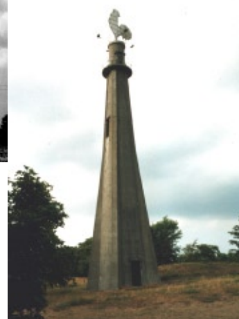
Nu er der kun betontårnet tilbage - og med en hane på toppen fungerer det som byens vartegn.