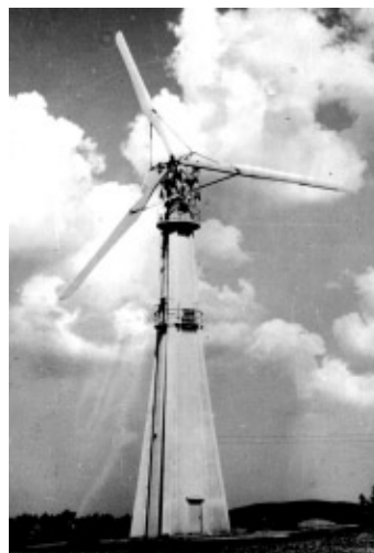
Den 3-vingede FLS "Aeromotor" i Fjerritslev - opført 1943.

Den senere forøgsmølle i Gedser, der er bevaret på El-museet er med fuld ret blevet betegnet som "alle moderne møllers moder" - men så må FLS-møllerne tilhøre "bedstemor-generationen". Læs mere om dem i årsskriftet, som går i trykken lige efter nytår og kommer ud til medlemmerne omkring første februar.